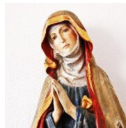
Bild: Hl. Agatha im Seniorenheim Hege

Die berühmte Märtyrin starb in Catania/Sizilien um 250 n. Chr. in der Zeit der Christenverfolgung. In Süddeutschland gibt es dazu reichhaltiges Brauchtum, bei uns im Allgäu besonders um Agathazell (bei Burgberg). Die gesegneten Brote gelten als Mittel gegen Heimweh und Schmerzen aller Art. Das Brot wird aufbewahrt und davon im Krankheits- und Heimwehfall gegessen. Auch bei Tieren, die zum ersten Mal den heimischen Hof verlassen, soll es gegen Heimweh helfen. Die mitgebrachten Agathastengel (4 Stangensemmel) werden gesegnet. Bitte vorne auf dem bereitgestellten Tisch ablegen und nach der Messe wieder abholen.