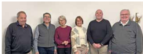
Der neue Vorstand des Golfclub Oberstdorf e. V.

Platzreifekurse für Neueinsteiger können jetzt schon auf der Webseite des Golfclubs gebucht werden. Die Verantwortlichen arbeiten mit Hochdruck daran, die Trainingseinrichtungen und den Platz so früh wie möglich zu öffnen. Genaue Termine zur Freigabe der Driving Range und der Spielbahnen werden kurzfristig über die Webseite ( www.golfclub-oberstdorf.de ) und den Newsletter bekannt gegeben.