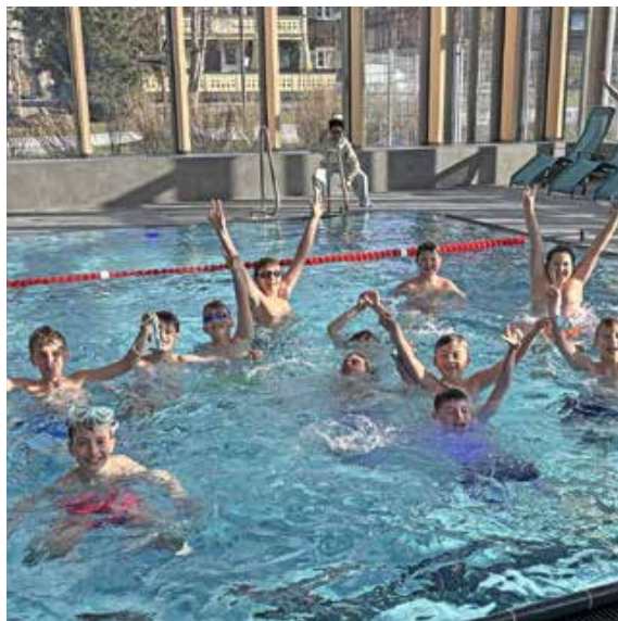
Schüler des Gymnasiums Oberstdorf beim Schwimmunterricht

Mit großer Begeisterung nehmen auch die Schüler des Gymnasiums Oberstdorf das Angebot an. Neben der gezielten Förderung der Schwimmfähigkeit – nicht nur für den Unterricht, sondern auch für ihre eigene Sicherheit – steht beim Schwimmunterricht der Spaß an der Bewegung im Vordergrund. Beim kreativen Floßbau mit Schwimmnudeln können die Schüler z. B. eigene Ideen umsetzen und gleichzeitig Erfahrung im Wasser sammeln.