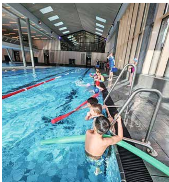
Schüler der Grundschule beim Schwimmen in der Therme

Nach den Faschingsferien begann das Schulschwimmen der Grundschule Oberstdorf in der neuen Therme. Jeweils montags, donnerstags und freitags können die Grundschüler sowohl das Sport- als auch das Erlebnisbecken nutzen. Die Kinder sind von dem neuen Schwimmbad begeistert. Mit viel Freude und Motivation nehmen sie am Schwimmunterricht teil und entwickeln ihre Fähigkeiten im Wasser stetig weiter. Die Grundschule profitiert von den neuen Gegebenheiten: moderne Räumlichkeiten und angenehme Atmosphäre in direkter Nachbarschaft, beste Voraussetzungen für einen gelungenen Unterricht. Herzlichen Dank für das Ermöglichen von Schwimmunterricht während der Bauzeit der Therme an das Parkhotel Frank!