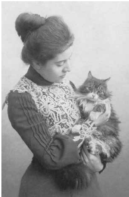
Gertrud von le Fort 1902

Als die junge Gertrud von le Fort um das Jahr 1900 der Zeitschrift „Der Türmer“ eigene Verse zur Veröffentlichung angeboten hatte, wurde ihr geantwortet: „Alles in allem nicht ganz hoffnungslos.“ Und der sorgenvolle Rat ihres Vaters lautete: „Kind, dichte, aber belästige niemanden damit.“ 50 Jahre später gehört sie nicht nur zu den damals meistgelesenen deutschsprachigen Autoren, sondern wird zu den großen europäischen Dichterinnen der ersten Hälfte des 20. Jahrhunderts gezählt.