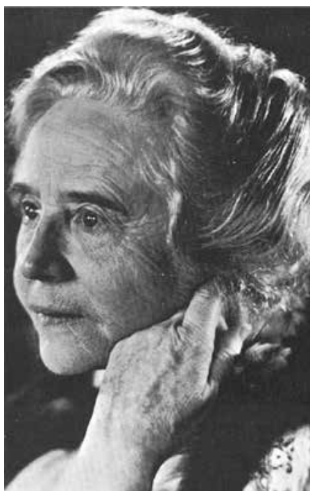
Gertrud von le Fort 1956

Durch ihre „Wahlheimat Oberstdorf“ wurde sie mehrfach geehrt: 1956 wurde ihr die Ehrenbürgerwürde, 1966 die Bürgermedaille verliehen. Zugleich wurde der „Buchstockweg“ in „Gertrud-von-le-Fort-Weg“ umbenannt. 1976 erhielt das örtliche Gymnasium ihren Namen. 1979 beschloss der Marktgemeinderat die Einführung der „Gertrud-von-le-Fort-Medaille“ als Ehrung für herausragende Leistungen im kulturellen und gesellschaftlichen Bereich. 2006 gründete sich die „Literaturgesellschaft Gertrud von le Fort e. V.“ mit dem Ziel, u. a. Gertrud von le Forts literarisches Erbe in Erinnerung zu halten.