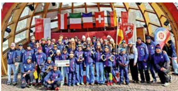
Die Mannschaft des Skiclub Oberstdorf

Die 59. Auflage des Jugend-Cups der Internationalen Skizentren fand 2026 zum zwölften Mal in Oberstdorf statt. Nach der Eröffnungsfeier inklusive Einzug vom Bahnhof zum Kurpark ging es in den zweitägigen Traditionswettbewerb. Die Oberstdorfer Mannschaft, mit Skirennläuferinnen und Skirennläufern auch aus der Region verstärkt, stellte sich in den Disziplinen Slalom und Riesenslalom dem internationalen Vergleich. Aufgrund der Wetteraussichten hatte man bereits im Vorfeld die Rennstrecken vom Fellhorn zum Söllereck verlegt. Hier gingen die Oberstdorfer mit den gleichaltrigen Mannschaften aus Schruns (AUT) Courchevel (FRA), Madesimo (ITA) und Saas-Fee (CH) an den Start. Die vier Gastnationen zollten dem Organisationskomitee des SCO große Anerkennung, das es schaffte, trotz widrigster Wetterbedingungen beide Wettkämpfe für alle 146 Athleten ordnungsgemäß und fair abzuhalten. In der Mannschaftswertung belegte das Oberallgäuer Team mit 541 Punkten nach dem souveränen Sieger Courchevel (668 Punkte), den Zweitplatzierten aus Saas-Fee (659 Punkte) und den Dritten aus Schruns (632 Punkte) den vierten Rang. Die Mannschaft aus Madesimo (307 Punkte) landete auf dem fünften Platz. Besonders erfreulich waren viele hervorragende Einzelplatzierungen, die zum Punktekonto Oberstdorfs beitrugen.