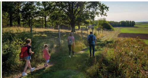
Wanderweg entlang des Tiergeheges