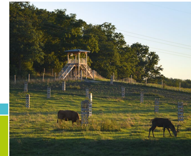
Blick auf den Aussichtsturm über die Hutungsfläche

Die Hutungsfläche in Hellmitzheim wird von den Weidetieren aktiv gestaltet. Durch die Beweidung entsteht eine strukturreiche Wiese (Kurzgras – Hochstauden). Sowohl das Rotwild, als auch das Gelbvieh, (alte Hausrindrasse) nutzen den eingezäunten Wald und schaffen hier durch Verbiss und Tritt Strukturen, die im Wirtschaftswald so kaum noch zu finden sind. Am Waldrand bildet sich durch die Beweidung eine halboffene Landschaft – Lebensraum für zahlreiche Schmetterlingsarten. Auf den Liegeflächen und Trittstellen entstehen durch die dauernde Nutzung der Tiere Rohbodenstandorte, die z. B. von verschiedenen Insektenarten, wie Sandbienen, besiedelt werden. Dunghaufen als Nahrungsquelle locken ebenfalls Insekten an. Die Wasserstelle für die Weidetiere ist gleichzeitig ein Amphibienhabitat, z. B. für die Gelbbauchunke. Die alten Huteeichen sind reich an Spalten und Höhlen. Halsbandschnäpper und Fledermäuse finden dort Unterschlupf und auf der insektenreichen Hutefläche reichlich Nahrung.