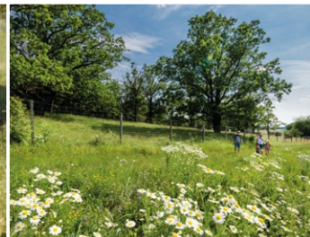
Hutewaldrest mit ca. 200 Jahre alten Eichen