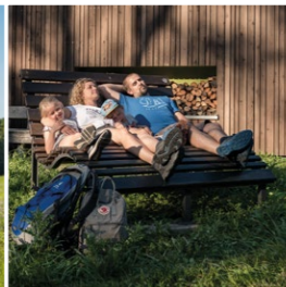
Genuss für Körper und Geist