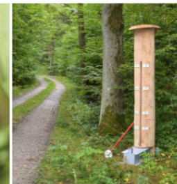
„Hau den Quercus!“