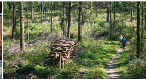
Bewirtschafteter Mittelwald bei Iphofen