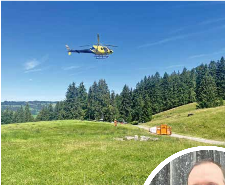
Wegebau – manche Stellen sind nur mit dem Hubschrauber erreichbar.