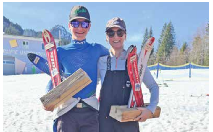
Clubmeisterschaft Alpin 2025.