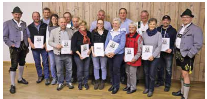
Die geehrten Mitglieder.