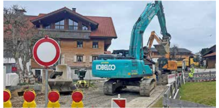
Die Baumaßnahmen des BA II für den Hochwasserschutz in Wagneritz haben begonnen.