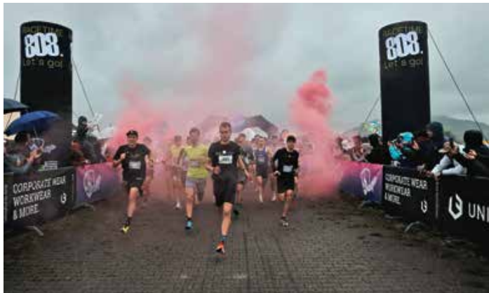
Teilnehmer der Grüntenstafette.

Also: Teams formieren, Anmeldung vormerken, am 28. April einen Spot sichern – und dann heißt es im September wieder: Nüf. Nah. Tralala!