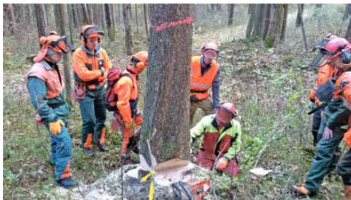
Im Praxisteil des Kurses lernen die Teilnehmer, einen Baum sicher zu fällen.

Amt für Ernährung, Landwirtschaft und Forsten Kempten (Allgäu)