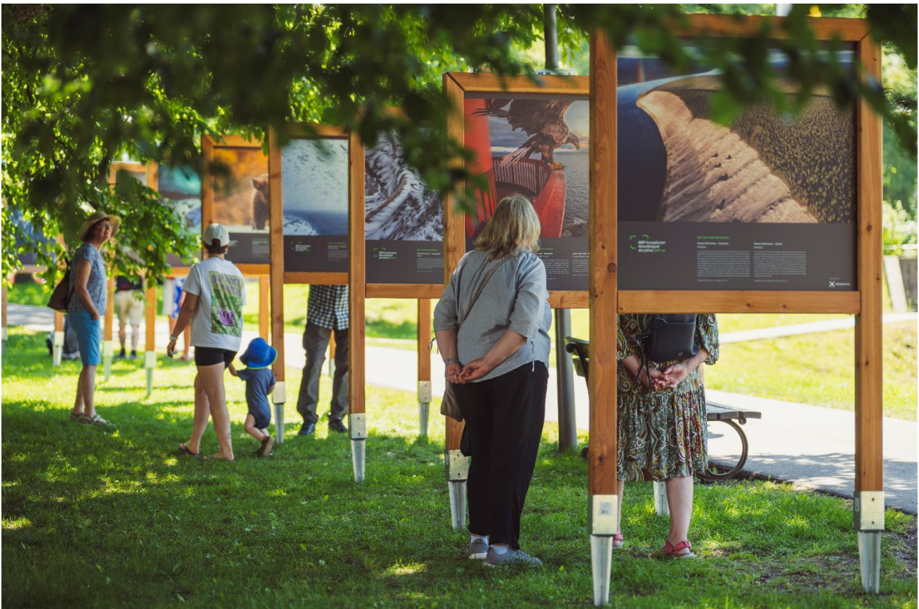
Ausstellung „RAW ADVENTURE – Zwischen Instinkt und Expedition“ der GDT.

Traditionell bildeten auch die Preisverleihungen einen wichtigen Bestandteil des Festivals. Im Rahmen des DVF-Wettbewerbs „Abenteuer“ wurden die 40 besten Fotografien aus zahlreichen Einsendungen ausgezeichnet und in einer eigenen Ausstellung präsentiert. Ebenso gab es die Preisverleihung der interaktiven Naturfoto-Safari der Gesellschaft für Naturfotografie (GDT). Die Gewinnerinnen und Gewinner wurden für ihre kreativen Beiträge und ihr fotografisches Können ausgezeichnet und durften sich über hochwertige Preise aus der Fotobranche freuen. „Besonders schön finde ich, dass hier nicht nur etablierte Fotografinnen und Fotografen ausstellen und gewürdigt werden, sondern auch der fotografische Nachwuchs und ambitionierte Hobbyfotografinnen und -fotografen eine Bühne erhalten“, sagte ein Teilnehmer nach der Preisverleihung. „Solche Auszeichnungen motivieren ungemein und zeigen, dass sich Leidenschaft, Kreativität und Engagement lohnen. Der Fotogipfel bringt Fotobegeisterte auf eine tolle Art und Weise zusammen, das habe ich so noch nicht erlebt.“