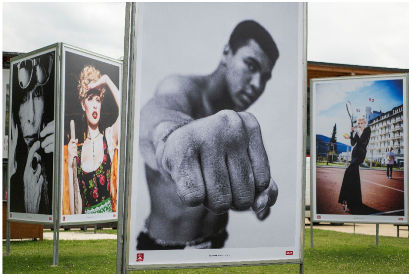
Eine Ausstellung im Rahmen des Fotogipfels vor dem Oberstdorf Haus

Das neue Logo des Fotogipfels Oberstdorf Konzeption: b.lateral Sipplingen