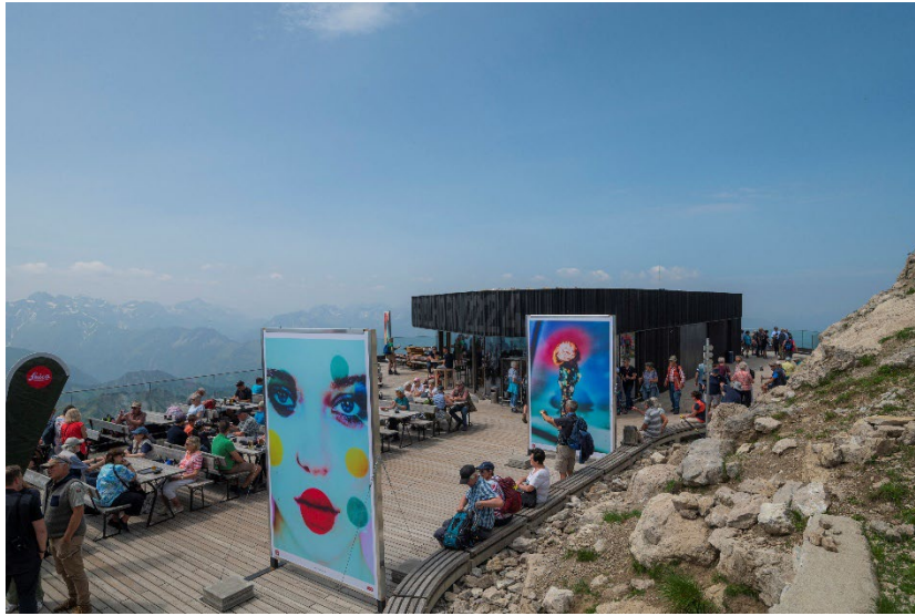
Die Ausstellung auf dem Nebelhorn besticht durch ihre imposante Kulisse

Mehr Impressionen zum Fotogipfel allgemein finden Sie hier: Fotoimpressionen