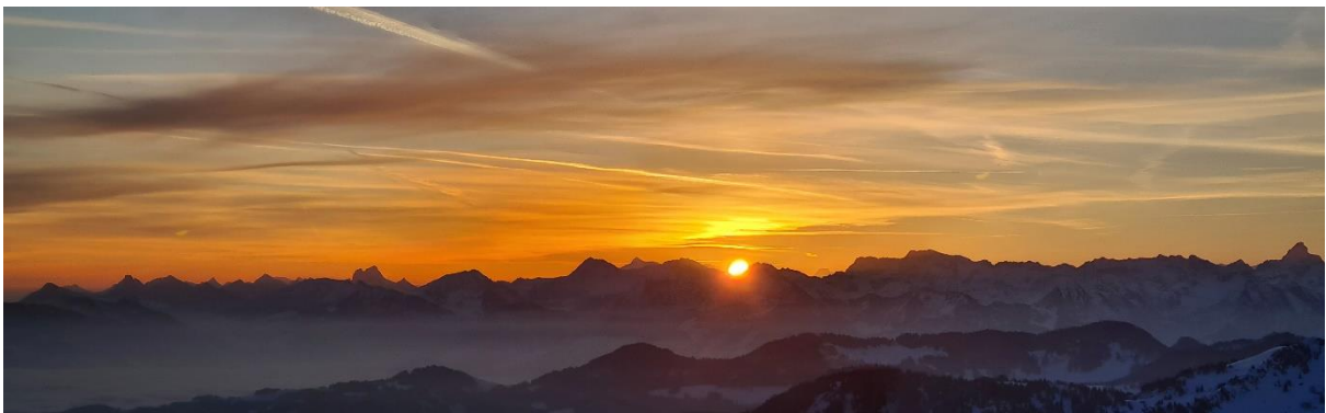
Foto um Foto wird gemacht, und gleich denen geschickt, die unter dem Nebel zuhause im Bett liegen, und diesen überwältigenden Augenblick versäumt haben.

Pünktlich, 3 min bevor die Sonne über dem Allgäuer Hauptkamm aufgeht, sind wir am Gipfel. Der Nebel liegt unter uns, er hat uns nicht mehr eingeholt. Freie Sicht vom Alpstein über Rätikon, Silvretta, Bregenzerwald bis zu Und dann kommt sie – die Sonne und strahlt jeden einzelnen Gipfel an.