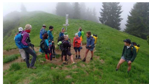
Trotz angesagten Sommerwetters erwarteten unsere 12-köpfige Gruppe beim Start an der Höllritzer Alpe eisiger Wind und Nebelreiben. Unterwegs kamen wir mit zwei Äplern ins Gespräch, die gegen Kreuzkraut spritzten.