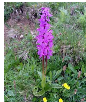
Doch bald war der „Spuk“ vorbei, und wir genossen auf dem gut angelegten, idyllischen Pfad die üppige Vegetation am Dreifahrenkopf und Grauenstein.