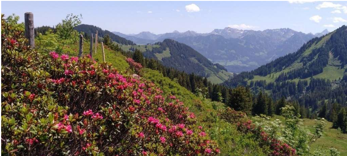
Panorama-Rundwanderung von der Höllritzer Alpe, ca. 650 Höhenmeter und 6 Std. Gehzeit. Foto: ausgedehnte Alpenrosenfelder am Grauenstein.