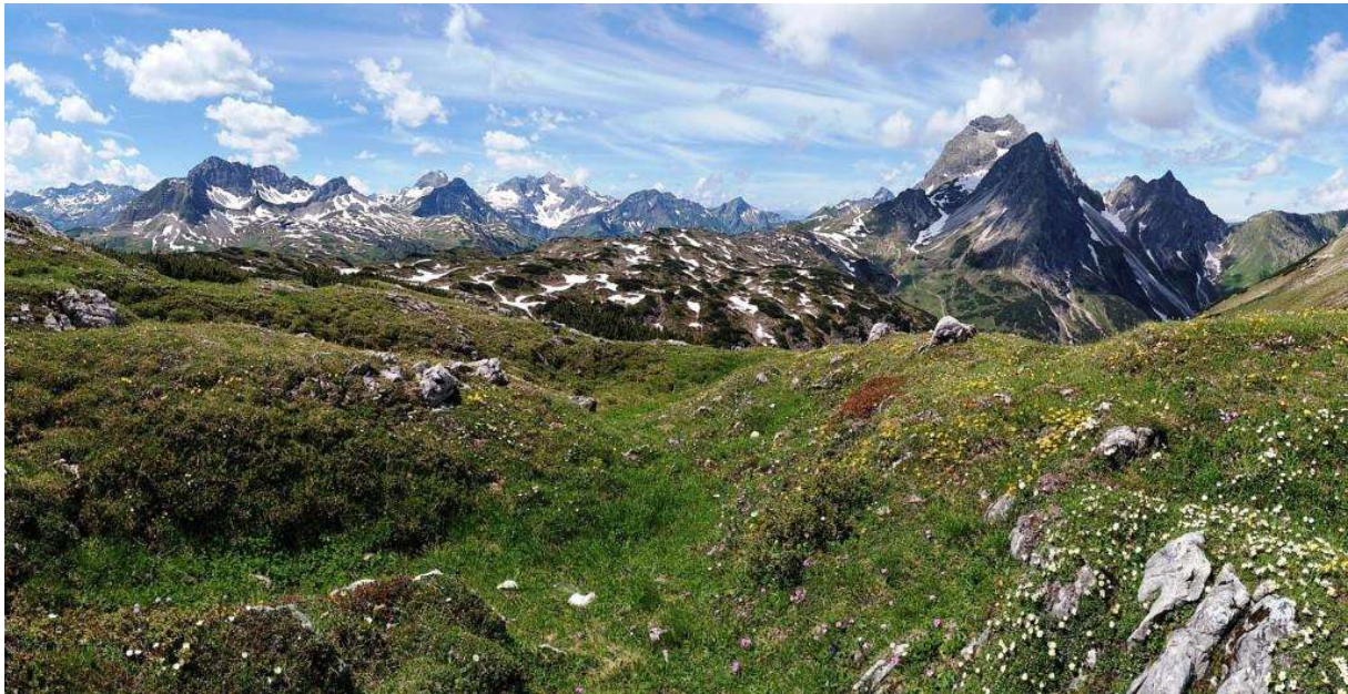
Foto: am Koblat-Pass, 2053 m, v.l.n.r.: Gr. Wildgrubenspitze, Karhorn, Mohnenfluh, Braunarlspitze, Hochberg, Rothorn, Hochkünzelspitze, Widderstein.

Die Inzidenz ließ es nach einer gefühlten „Ewigkeit“ endlich wieder zu, mit mehreren Personen aus unterschiedlichen Hausständen mit dem DAV-Bus zu einer Tour zu starten. Natürlich unter den gegebenen Bedingungen: Corona-Erklärung vorab, FFP2-Maske im Bus, für die Einkehr in Österreich getestet, geimpft oder genesen. Die meisten Teilnehmer waren schon geimpft.