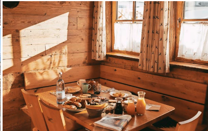
Alpine Exklusivität trifft auf Privatsphäre: Stilvolles Design, Wellness und Naturerlebnis in den Alpin Chalets Oberjoch.

und ausgewählte vegetarische Kreationen treffen hier auf ein stilvolles Ambiente und aufmerksamen Service. Regionale Produkte und kreative Küche verbinden sich zu einem Genusslebnis, das sich ganz nach den eigenen Vorlieben richtet.