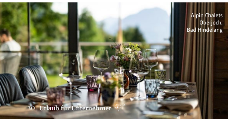
Alpin Chalets Oberjoch, Bad Hindelang